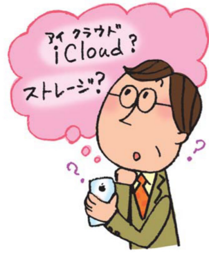
イラスト・きつまき

私のスマートフォンに先日、「このiPhoneをバックアップするのに十分なiCloudの空き容量がありません。iCloudストレージを追加してください」というような文章が表示されました。意味がわからないので仕方なく自分で調べました。「スマホのデータをネット上に保存する容量が足りないのを追加せよ」という意味だと理解し、無事に追加できま