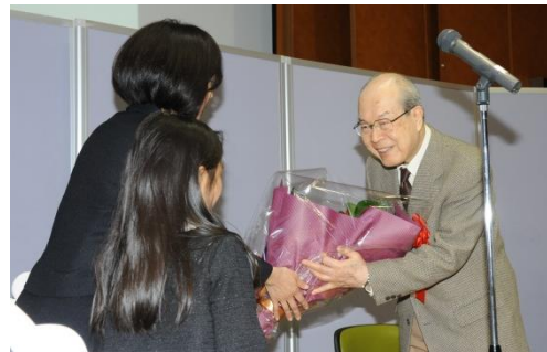
親子2代の愛読者から花束を贈りました

3月20日の贈呈式は、読者の親子約100人も一緒に祝いました。親子2代の読者もあり、「子どもが小学生になるのを機に朝日小学生新聞を手にとったら、自分が小学生のとき読んでいた『ジャンケンポン』がまだ連載されていて、とてもうれしかった」と話していました。