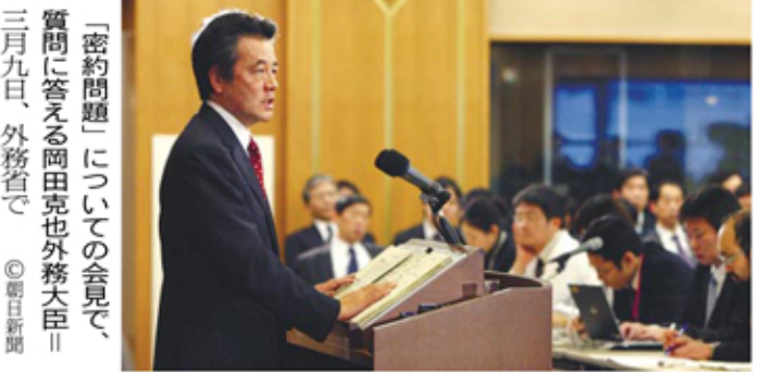
「密約(みつやく)問(もん)題(だい)」につ(につ)いての会(かい)見(けん)、質(しつ)問(もん)に答(こた)え(え)る岡(おか)田(た)克(とく)也(や)外(がい)務(む)大(だい)臣(しん) 三月(さんがつ)九(きゅう)日(にち)、外(がい)務(む)省(しょう)で。

質(しつ)問(もん) 1 □□□□(さん)に(に)入(はい)る日本(にっぽん)の元(もと)首(しゅ)相(さ)の(の)名(な)前(まえ)を(を)答(こた)え(え)て(て)ね。